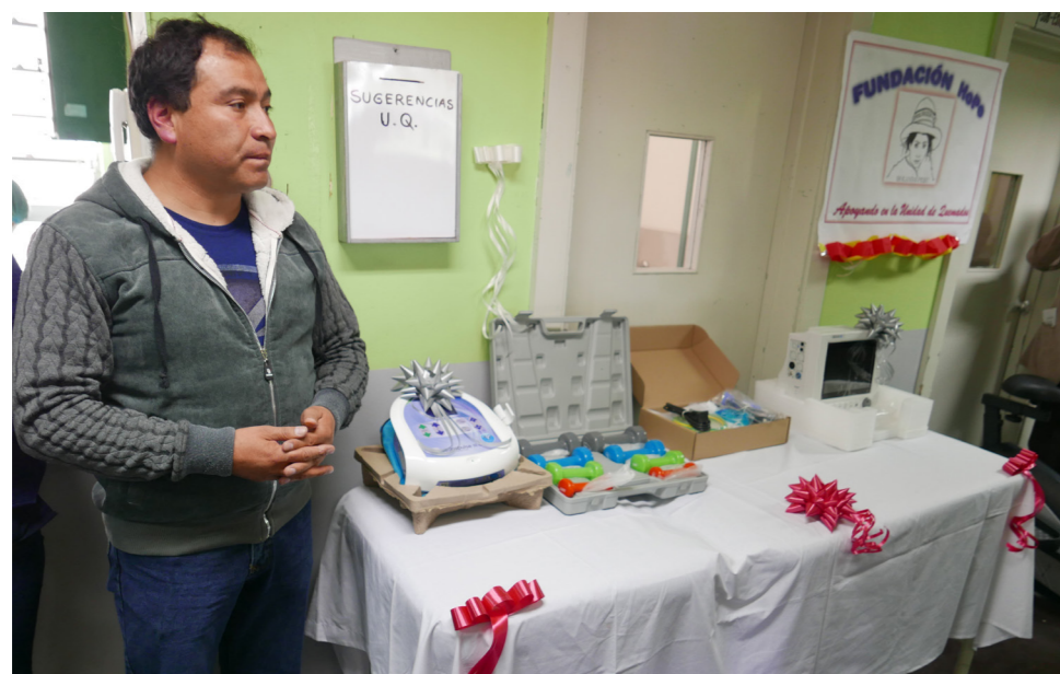
Overdracht materialen voor de revalidatieafdeling van het brandwondencentrum van het Regionaal Ziekenhuis in Cusco

Er zijn plannen om meer te doen met sociale media om contacten met (mogelijke) sponsors te intensiveren. Team HoPe in Cusco eind 2018