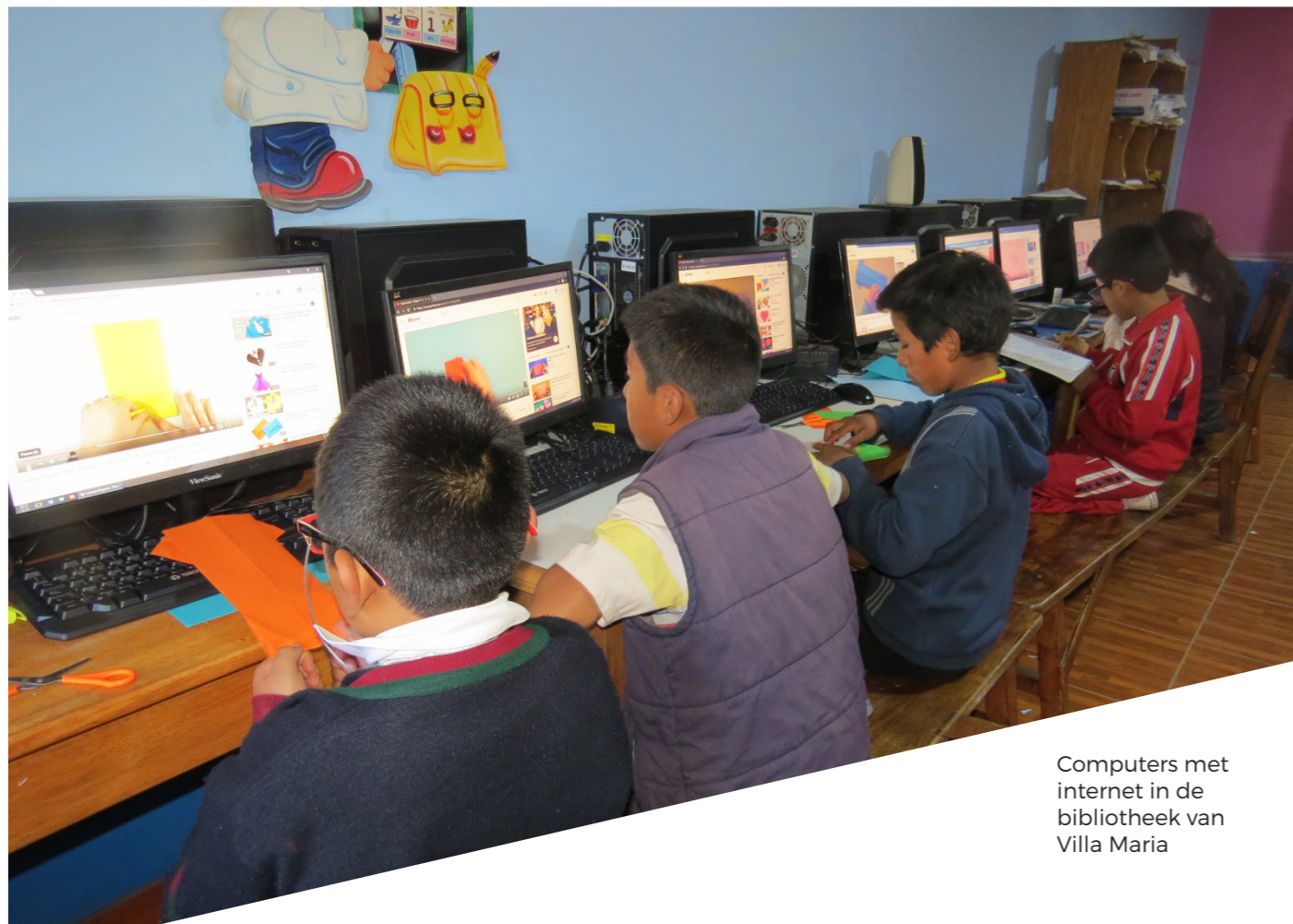
Computers met internet in de bibliotheek van Villa Maria