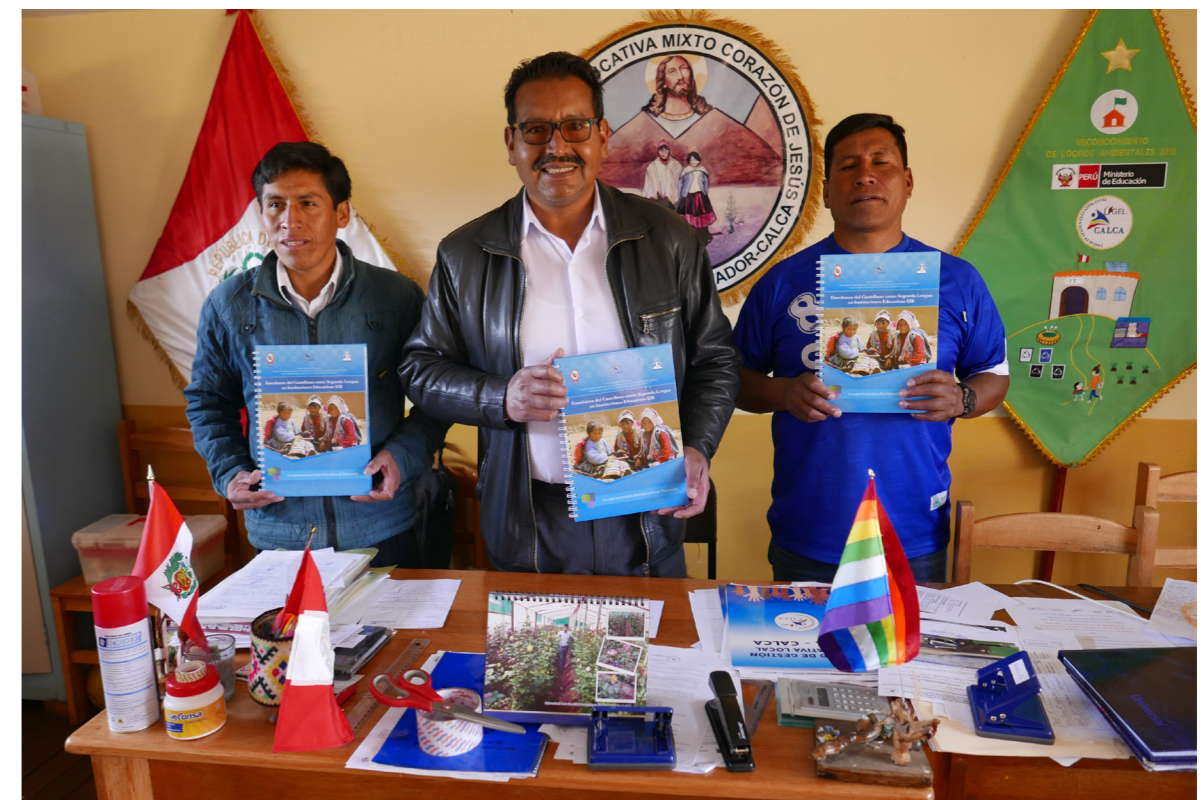
Docenten Tiracancha tonen de uitgave "Systematisering Spaans als 2e Taal"