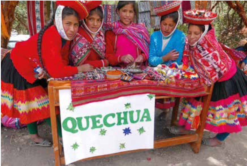
Trots op hun cultuur en taal