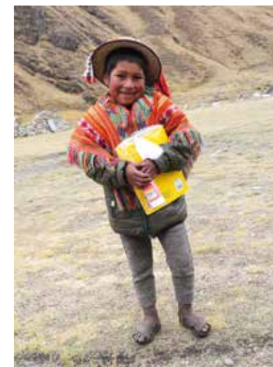
Blij met een tas met schoolspullen

Leden van de dorpsraden waren verantwoordelijk voor de distributie en het weer inzamelen van de opdrachten.