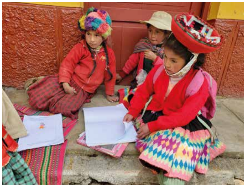
Huiswerk maken in een groepje

maand sterk verschillen. De scholen zijn het hele jaar 2020 gesloten gebleven. Het ministerie heeft op verschillende manieren geprobeerd om thuisonderwijs te verzorgen. Via televisie en internet werden programma's verzorgd die kinderen moesten volgen. Leerkrachten moesten de kinderen van huis uit begeleiden, hetzij via internet, hetzij via een telefoonverbinding.