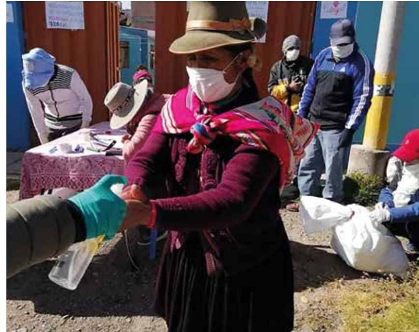
Handel tijdens lockdown

Het is dus niet meer dan logisch dat de coronacrisis de uitvoering van de voorgenomen programma's Hope in Peru enorm in de war heeft geschopt. Vrijwel geen enkel programma is uitgevoerd zoals dat aan het begin van het jaar gepland was. Het team van HoPe heeft alle plannen voor 2020 om moeten gooien.