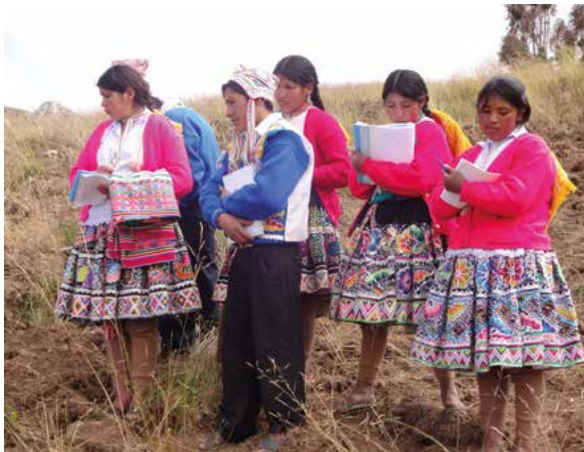
Veldwerk van een groepje scholieren

Enige jaren geleden heeft HoPe, samen met het Internationaal aardappelen centrum (CIP) uit Lima, een interessant onderwijsproject uitgevoerd. Het betrof een programma voor projectonderwijs waarbij leerlingen van klas 4 van de middelbare school uit Tiracancha onderzoek hebben gedaan naar alles wat te maken had met het thema aardappel, waaronder: verschillende rassen, kwetsbaarheid