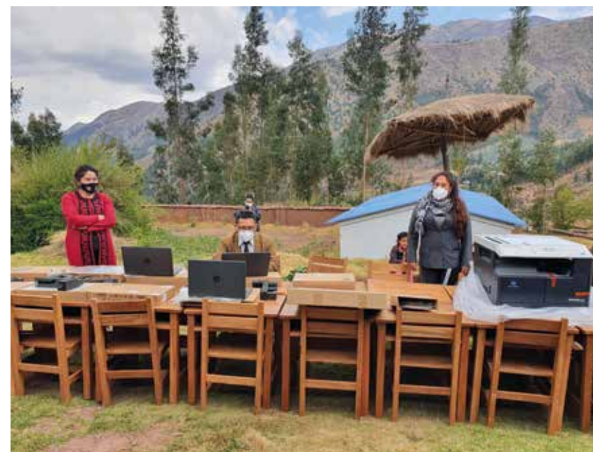
Hulp van HoPe bij de toerusting van een school bij een schoolinternaat

Het Ministerie van Onderwijs ondersteunt al enige jaren een model voor intercultureel tweetalig onderwijs, onderwijs dat uitgaat van de eigen cultuur en start vanuit de eigen taal. Naast de moedertaal is goede beheersing van het Spaans